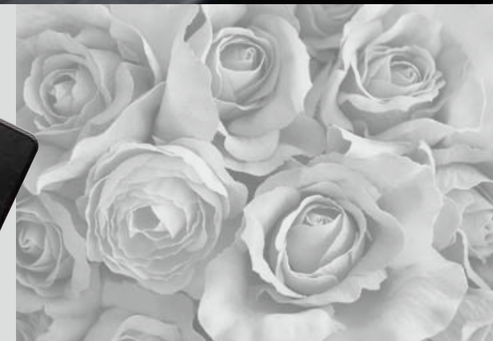
3次元形状へのヘアライン模様